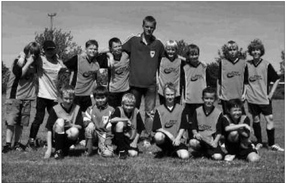
Staffelsieger Kreisklasse 2008/2009 E-Junioren: SV Dallgow 47 II