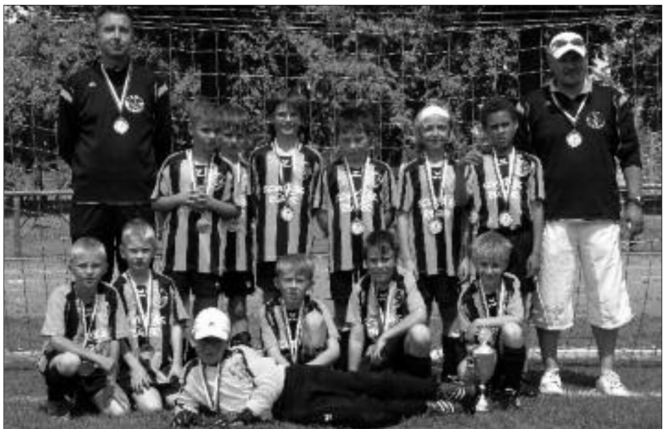
Staffelsieger Kreisliga 2008/2009 F-Junioren: SV Falkensee-Finkenkrug I