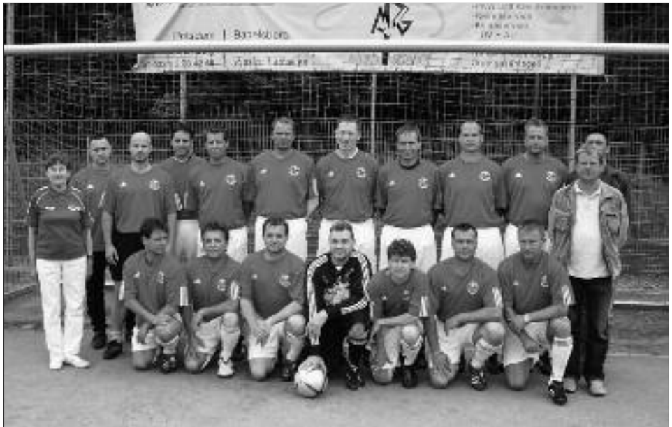
Senioren-Kreismeister Ü 35, 2008/2009: Potsdamer Sport-Union 04