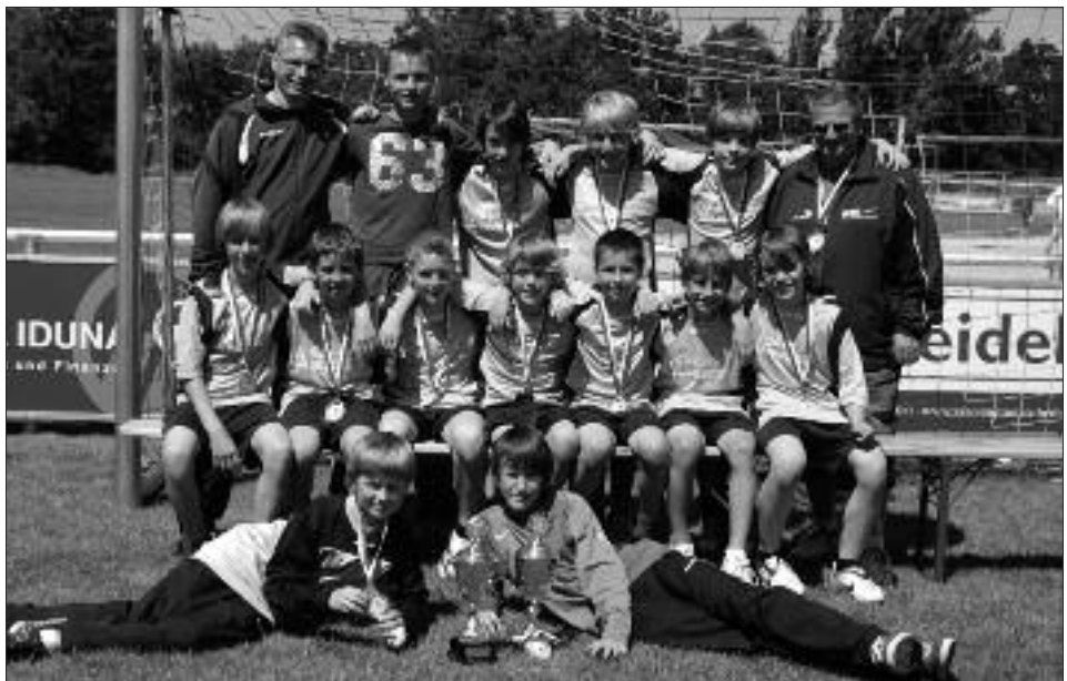
Kreismeister 2008/2009 D-Junioren: RSV Eintracht Teltow II