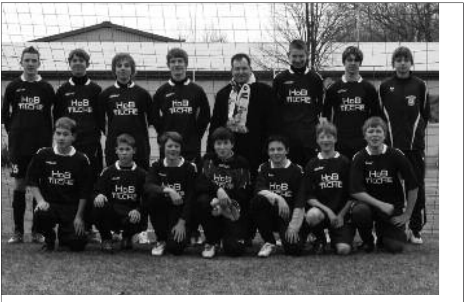
Kreismeister und Kreispokalsieger 2008/2009 C-Junioren: SG Blau-Weiß Pessin