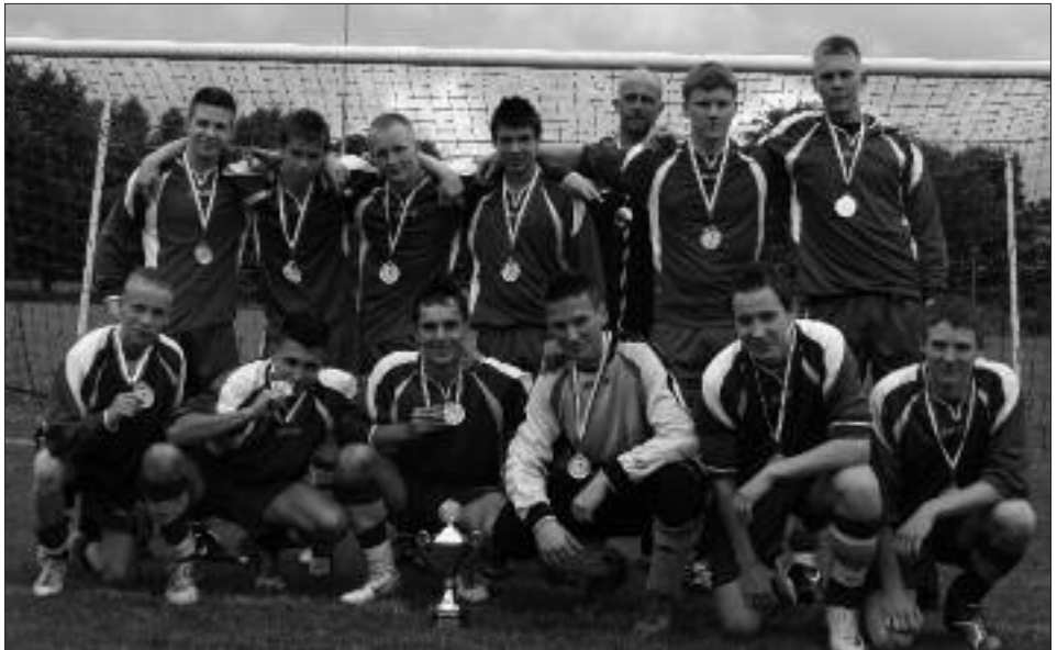
Kreismeister 2008/2009 B-Junioren: Caputher SV 1881