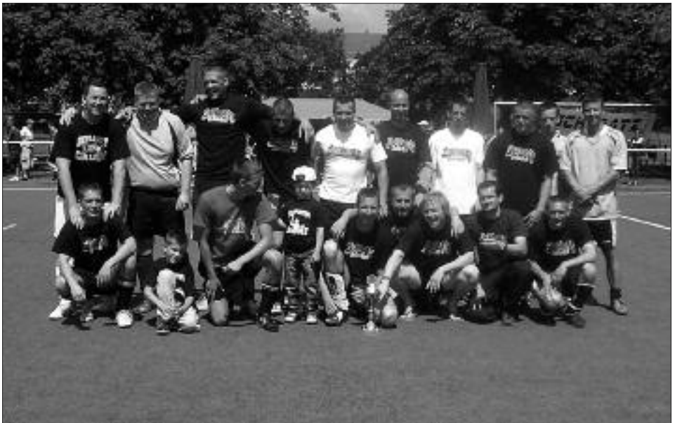
Kreismeister und Staffelsieger Freizeitliga 2008/2009, Staffel B: Jugendclub „alpha“