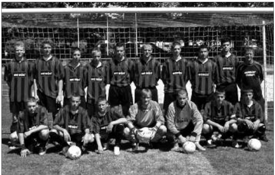
Staffelsieger Kreisliga 2008/2009 A-Junioren: SG Michendorf