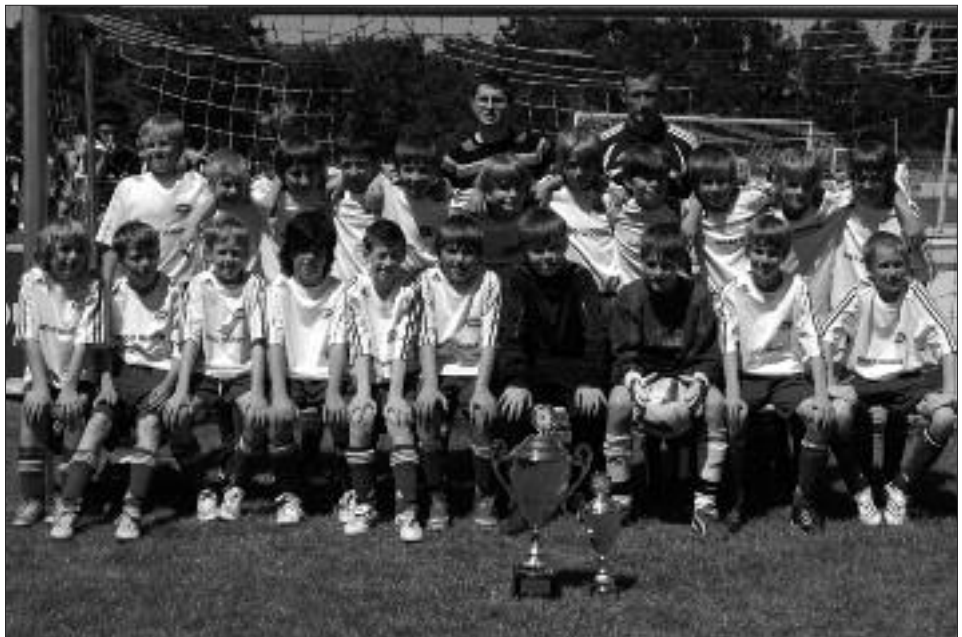
Kreismeister 2008/2009 E-Junioren: RSV Eintracht Teltow III