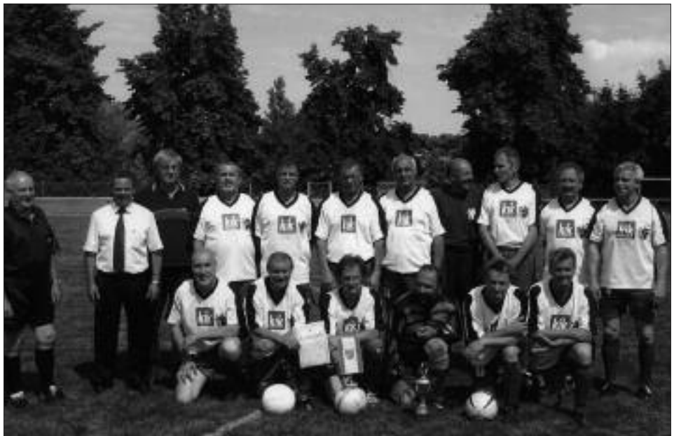
Senioren-Kreismeister Ü 50 2008/2009: FSV 95 Ketzin/Falkenrehde