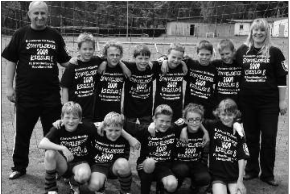
Staffelsieger Kreisliga 2008/2009 E-Junioren: SG Blau-Weiß Beelitz I