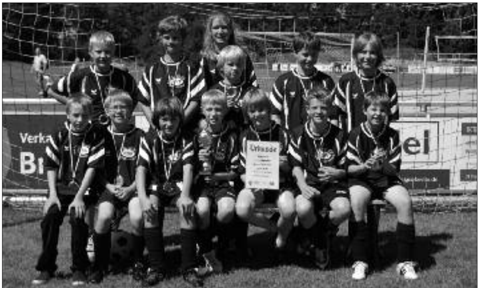
Kreispokalsieger und Staffelsieger Kreisklasse 2008/2009 E-Junioren: RSV Eintracht Teltow IV