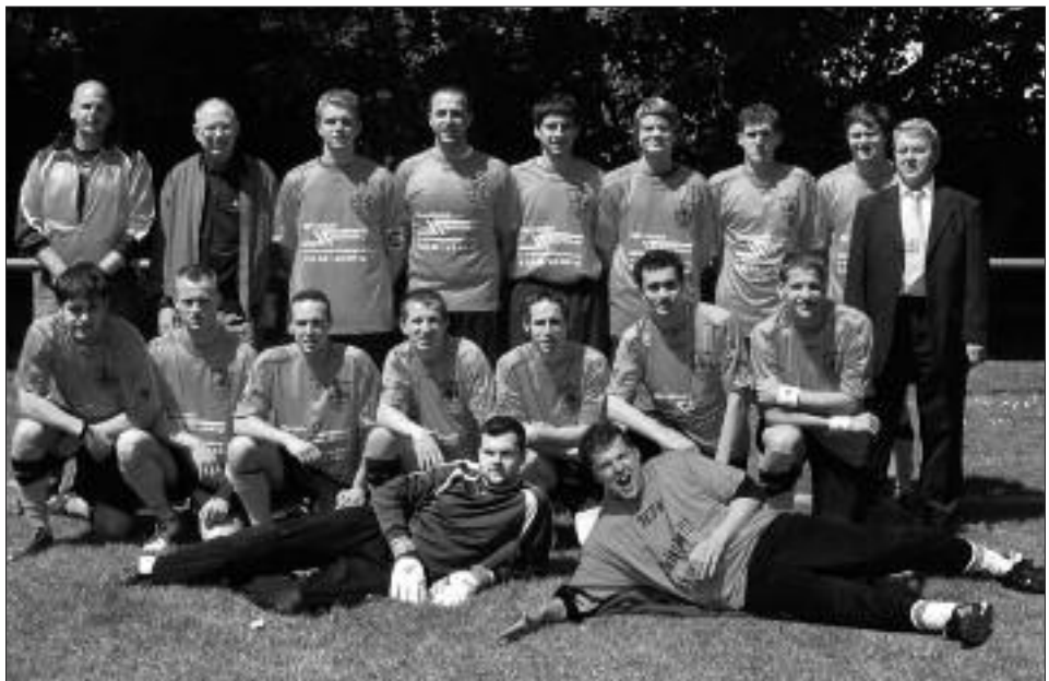
Staffelsieger 3. Kreisklasse 2008/2009, Staffel B: FC Falkensee 08 I