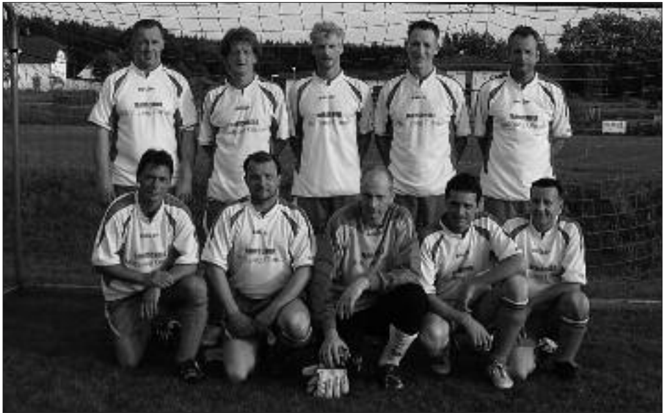
Staffelsieger Senioren-Kreisklasse Ü 40 2008/2009, Staffel C: Potsdamer Sport-Union 04