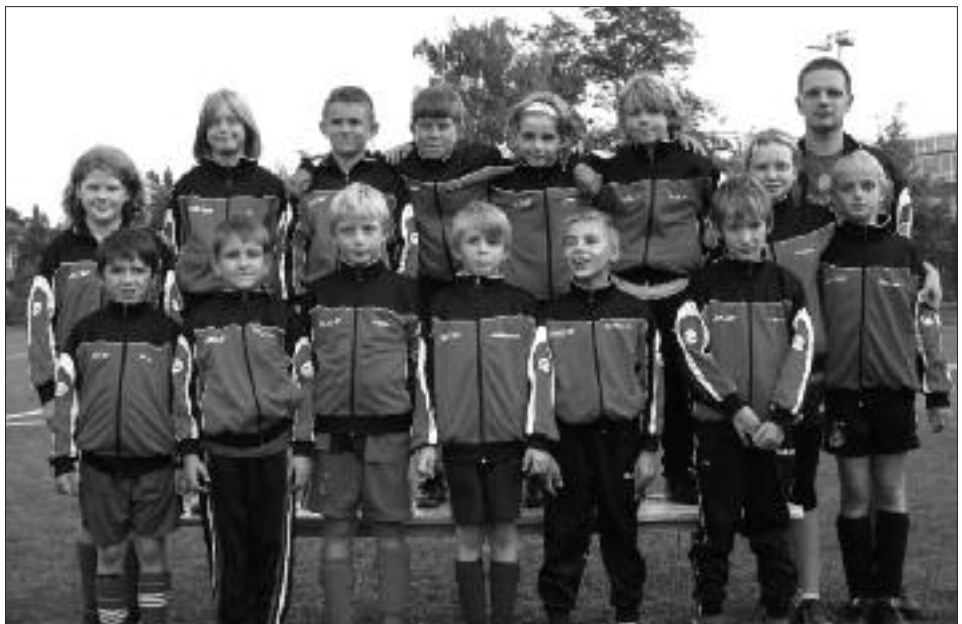
Staffelsieger Kreisklasse 2008/2009 E-Junioren: Fortuna Babelsberg II