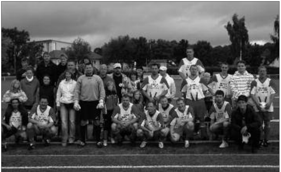
Staffelsieger 2. Kreisklasse 2008/2009: Fortuna Babelsberg III