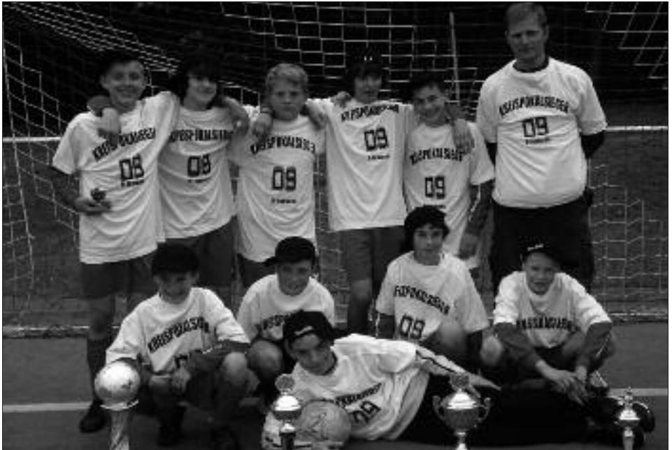
Kreispokalsieger 2008/2009 D-Junioren: SG Michendorf I