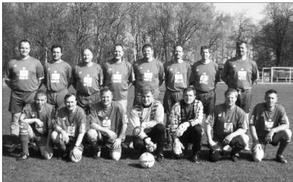
Staffelsieger Senioren-Kreisklasse Ü 40 2008/2009, Staffel A: VfL Nauen