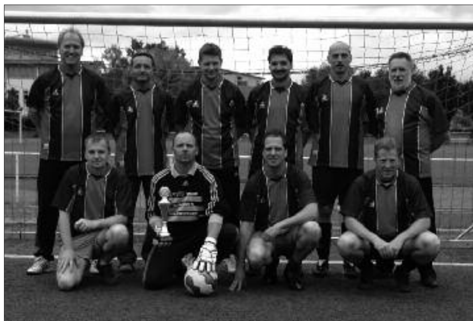
Staffelsieger Senioren-Kreisklasse Ü 40 2008/2009, Staffel B: Fortuna Babelsberg