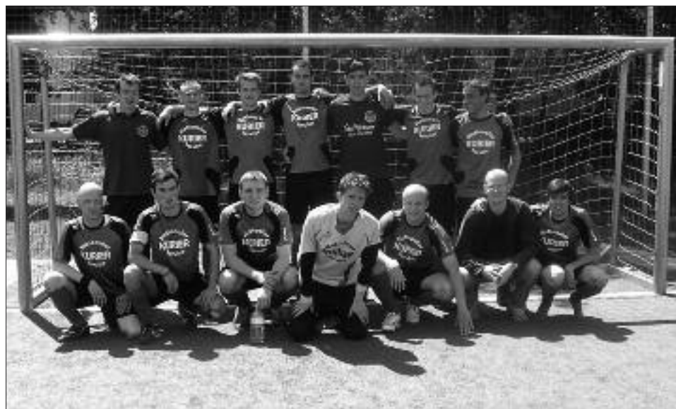
Staffelsieger Freizeitliga 2008/2009, Staffel A: Inter Fulk'n'Sey