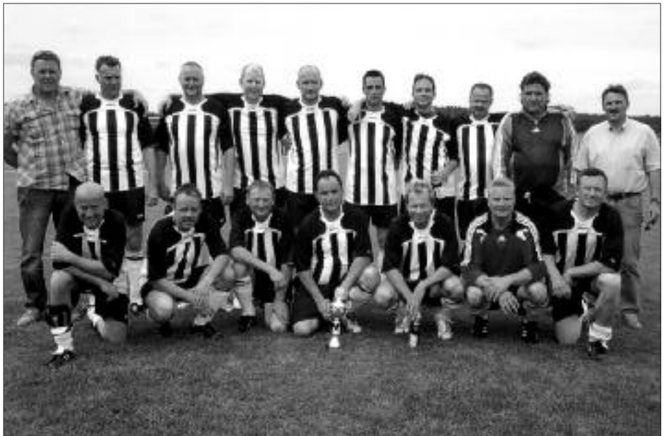
Sieger Seniorenpokal Ü40 2008/2009: SG Bornim