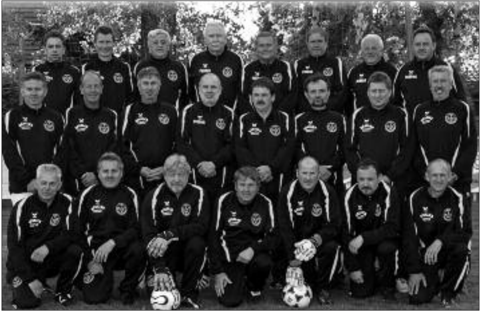
Sieger Seniorenpokal Ü 50 und Staffelsieger Senioren-Kreisklasse Ü 50 2008/2009: SV Falkensee-Finkenkrug