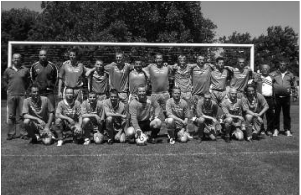
Staffelsieger 3. Kreisklasse 2008/2009, Staffel A: SG Grün-Weiß Golm