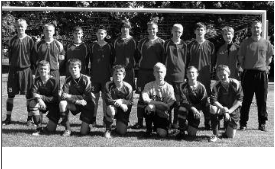
Staffelsieger 2008/2009 C-Junioren: Eintracht Friesack