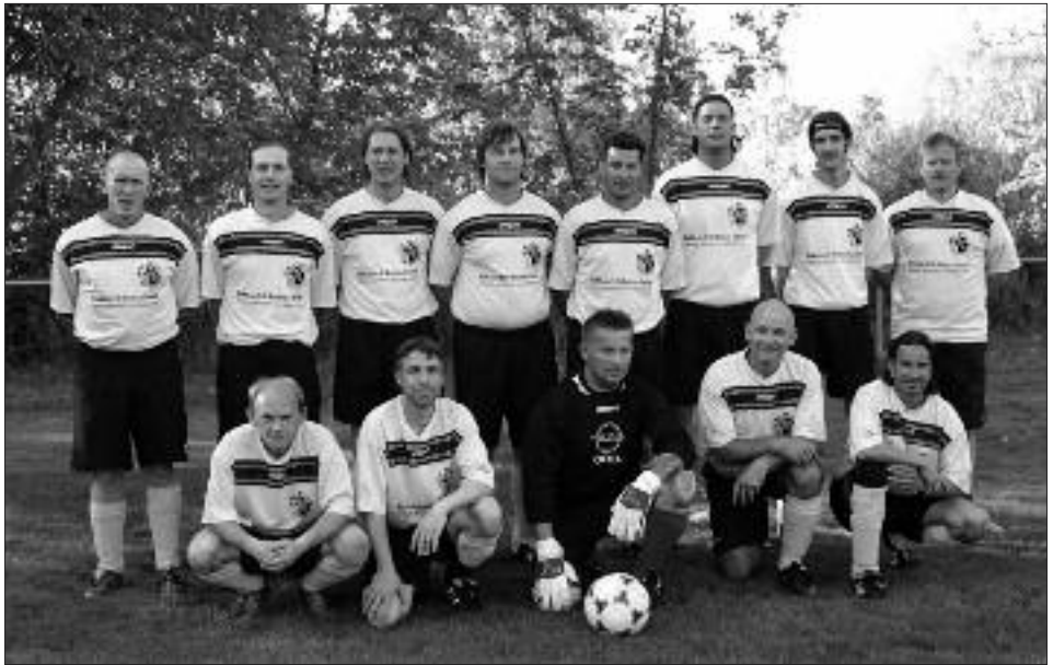
Sieger Wolfgang-Drescher-Pokal 2008/2009: FSV 95 Ketzin/Falkenrehde