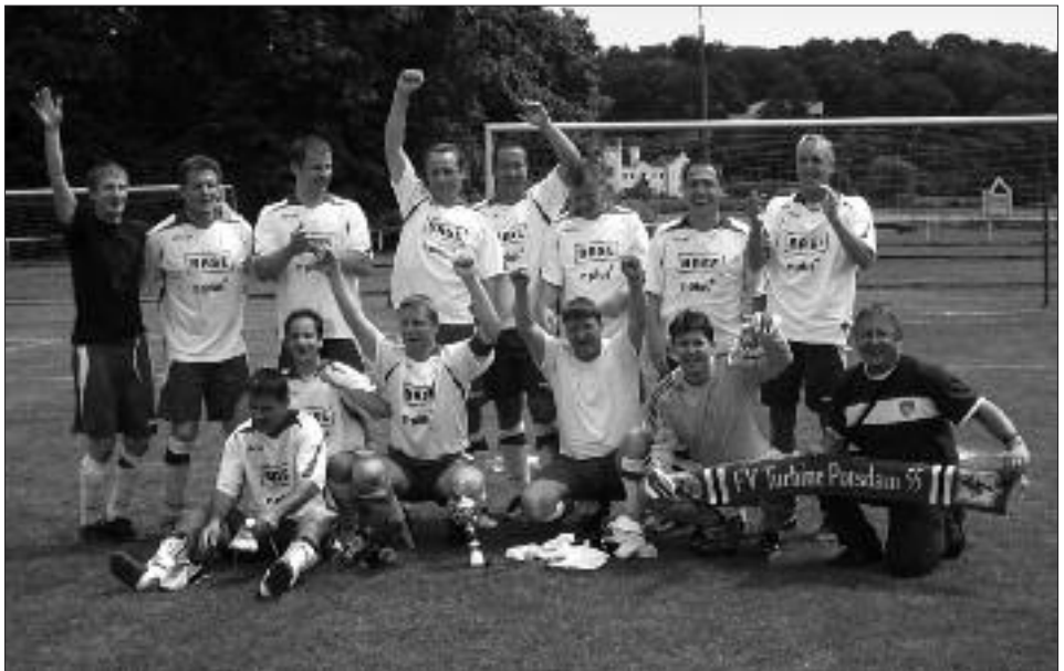
Meister Stadtklasse Potsdam 2008/2009: FV Turbine Potsdam 55 III