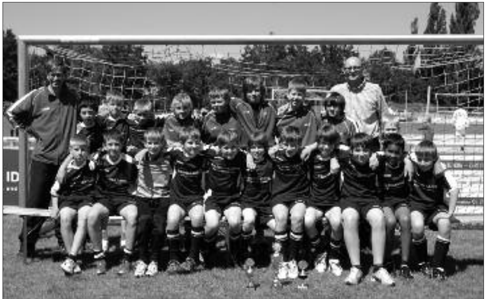
Staffelsieger Kreisklasse D-Junioren: RSV Eintracht Teltow III