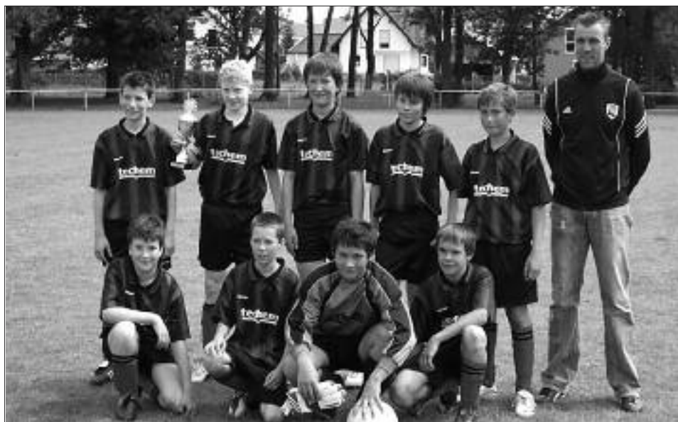
Staffelsieger Kreisklasse 2008/2009 D-Junioren: FSV 95 Ketzin/Falkenrehde