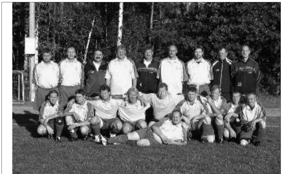
Staffelsieger Seniorenkreisklasse Ü 35 2008/2009: TSV Perwenitz