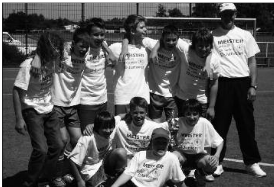
Staffelsieger Kreisklasse 2008/2009 D-Junioren: Werderaner FC Viktoria II