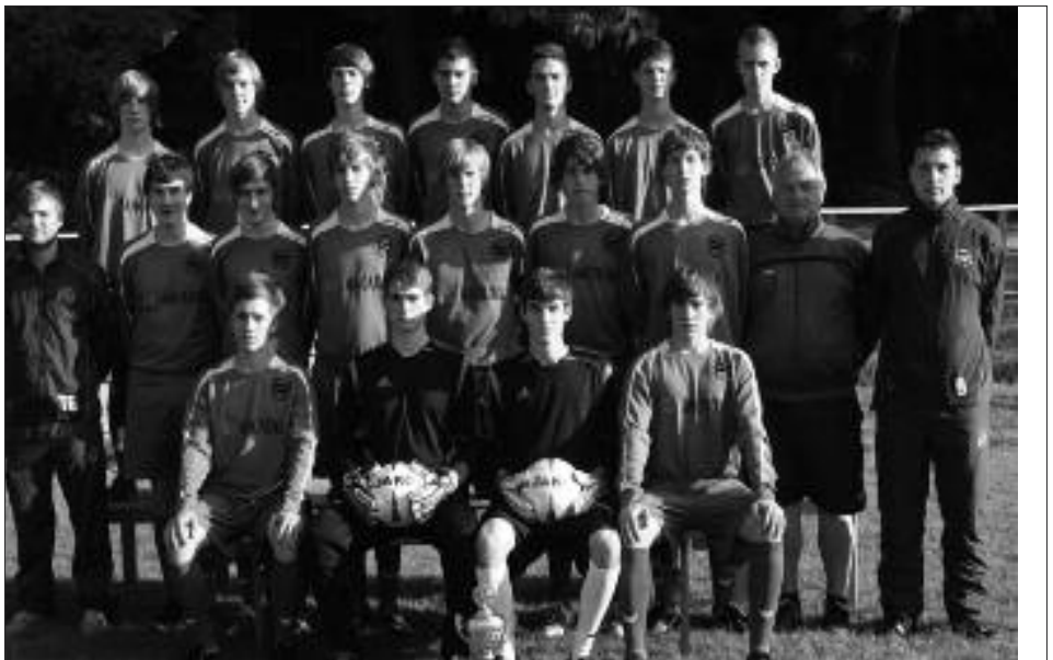
Kreispokalsieger 2008/2009 B-Junioren: SG Bornim