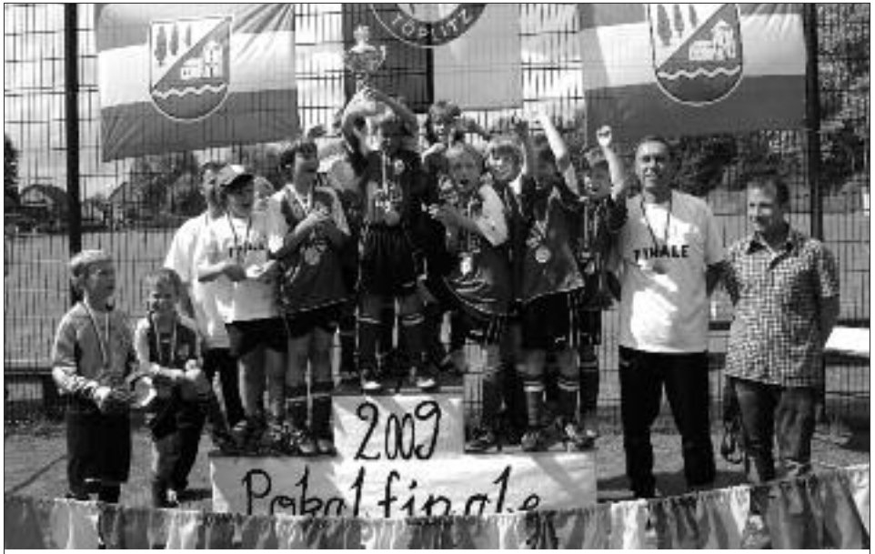
Kreispokalsieger 2008/2009 F-Junioren: FSV Babelsberg 74 I