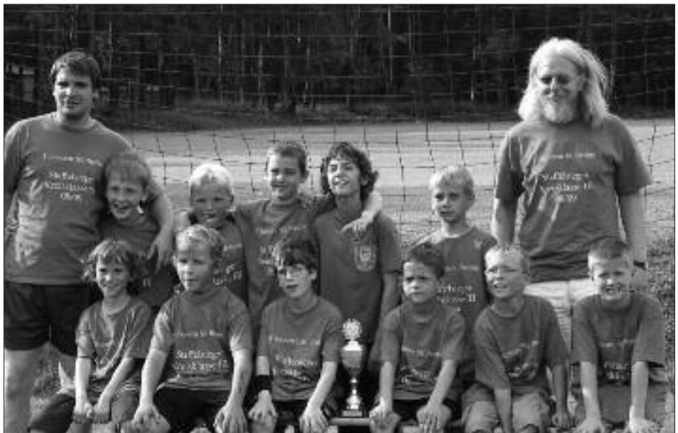
Staffelsieger Kreisklasse, Staffel I, 2008/2009 F-Junioren: SG Blau-Weiß Beelitz