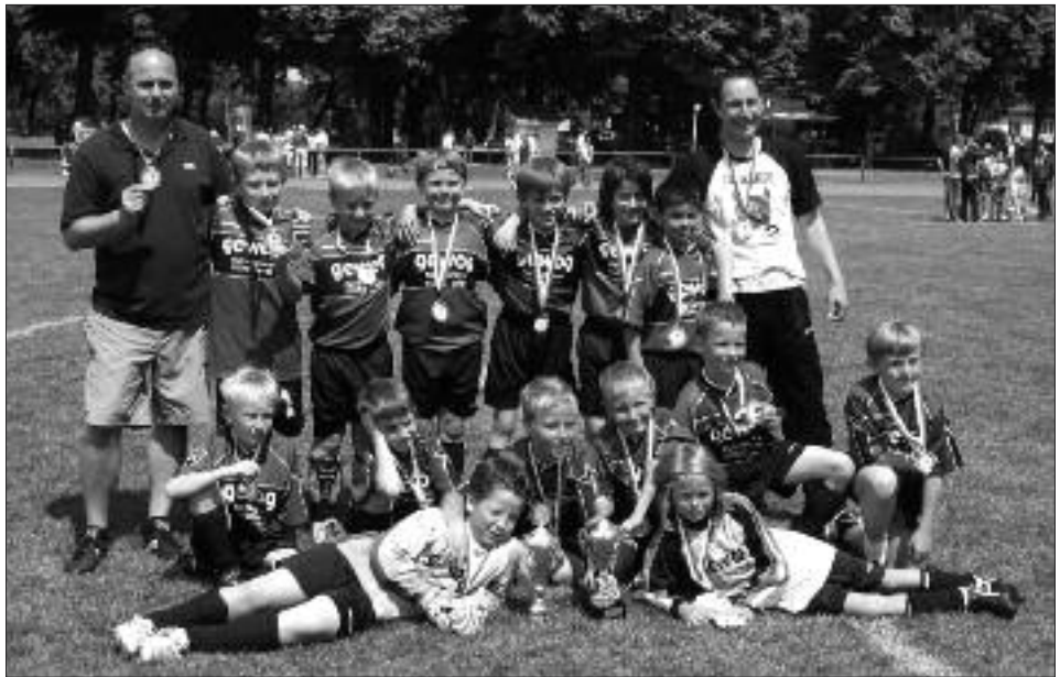
Kreismeister 2008/2009 F-Junioren: RSV Eintracht Teltow I