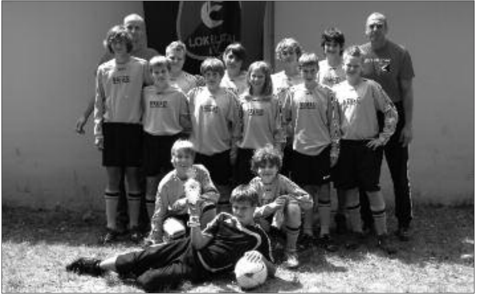
Staffelsieger Kreisliga 2008/2009 D-Junioren: ESV Lok Elstal