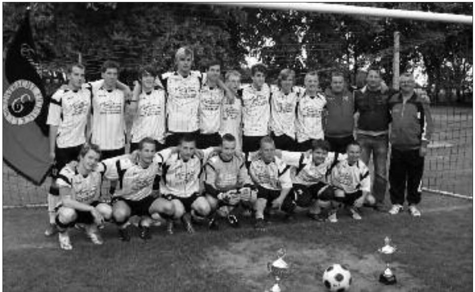
Kreismeister und Kreispokalsieger 2008/2009 A-Junioren: Eintracht Friesack