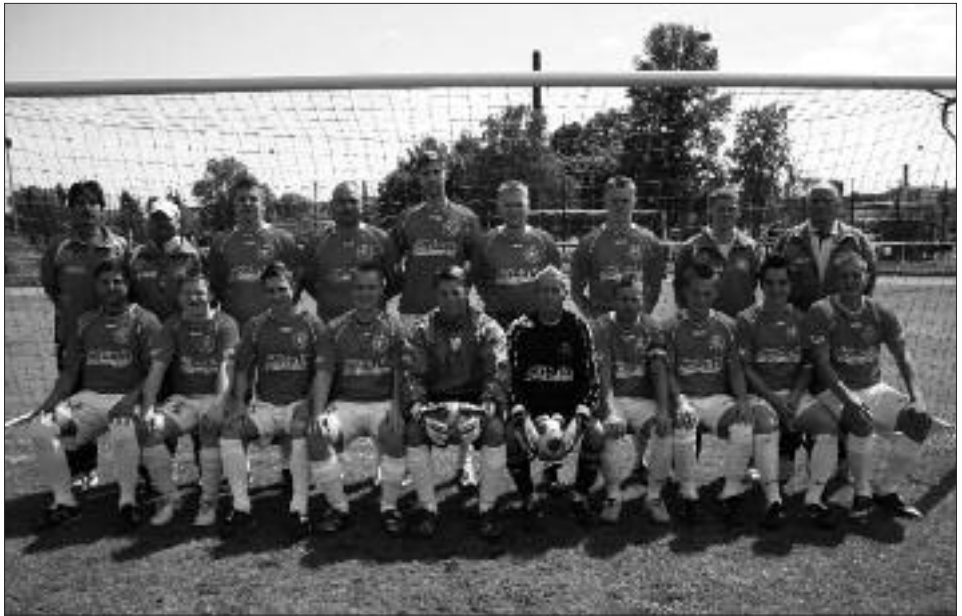
Staffelsieger 1. Kreisklasse 2008/2009: Werderaner FC Viktoria II