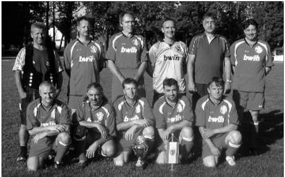
Senioren-Kreismeister Ü 40 2008/2009: FSV 95 Ketzin/Falkenrehde