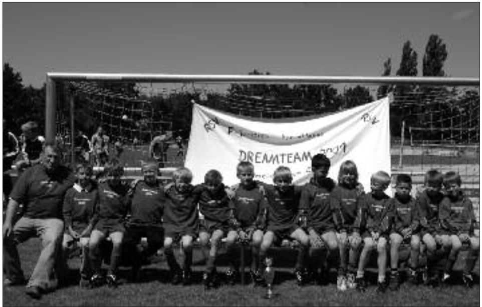
Staffelsieger Kreisklasse, Staffel I, 2008/2009 F-Junioren: RSV Eintracht Teltow IV