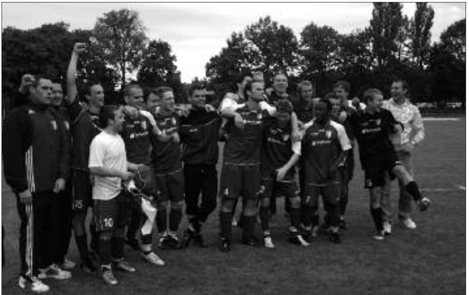
Kreispokalsieger 2008/2009: Potsdamer Kickers 94 II