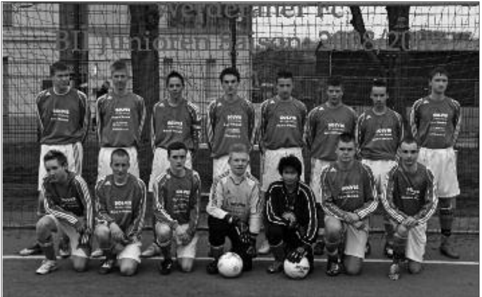
Staffelsieger 2008/2009 B-Junioren: Werderaner FC Viktoria II