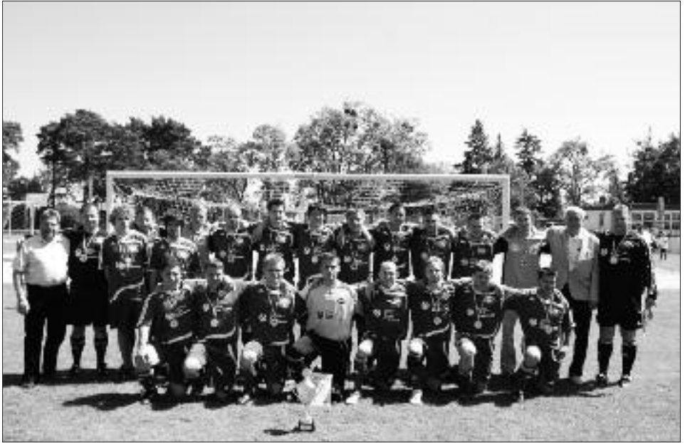
Kreismeister 2008/2009: RSV Eintracht Teltow