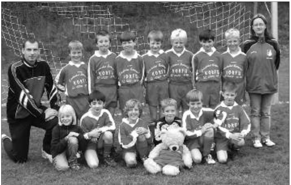
Staffelsieger Kreisklasse, Staffel I, 2008/2009 F-Junioren: SG Rot-Weiß Groß Glienicke II